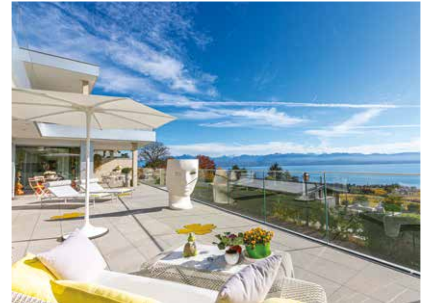
Appartement de 200 m 2 Vue Lac à Perroy, CHF 3'200'000.-.