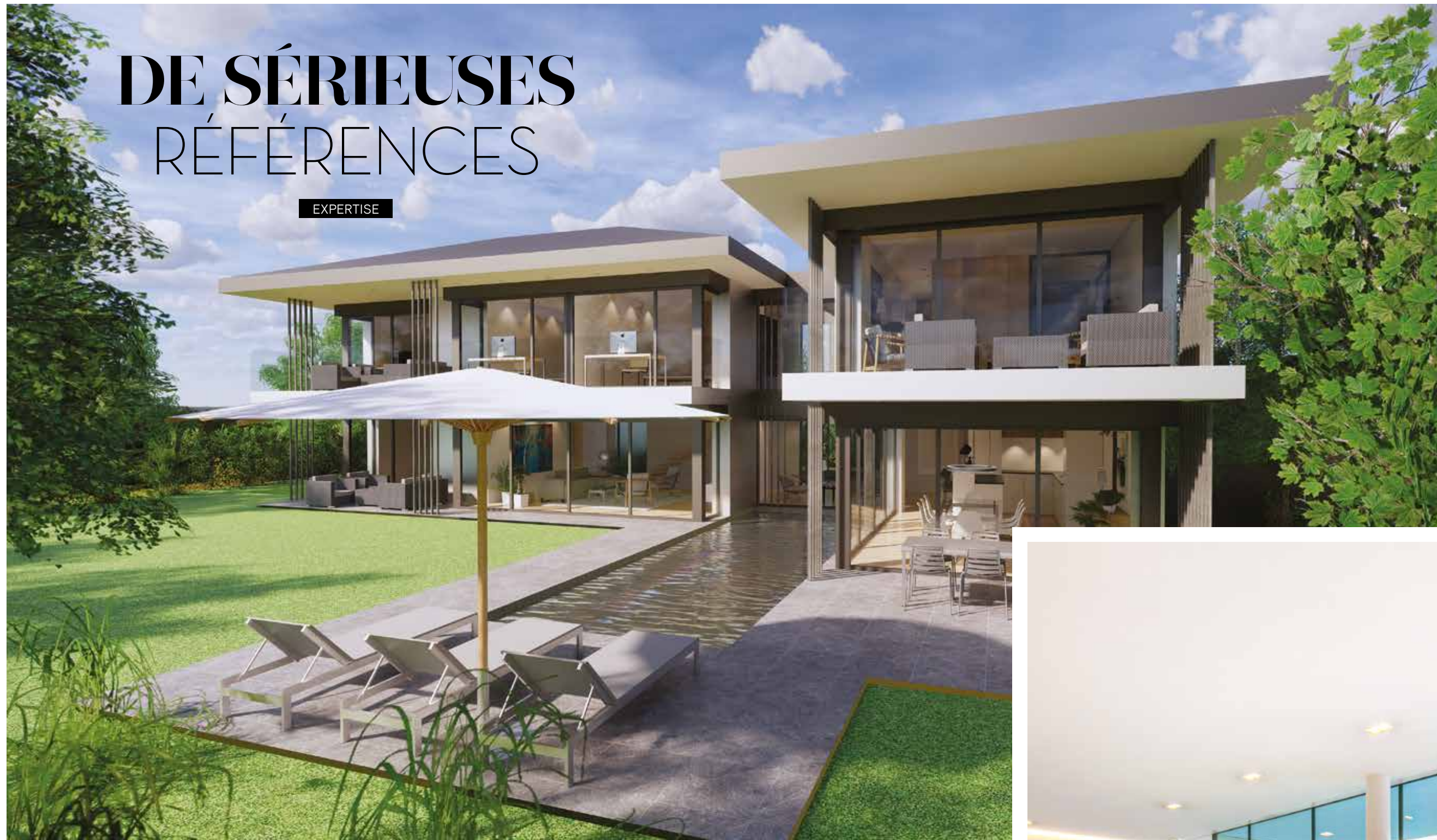
Construction de deux villas contemporaines de luxe à Mies, CHF 4'250'000.-.

MALGRÉ LA CRISE SANITAIRE ET SES CONSÉQUENCES SUR LE MARCHÉ DE L'IMMOBILIER, UNE CONJONCTURE INCERTAINE, L'ANNÉE 2020 A ÉTÉ POSITIVE POUR STONE INVEST À GENÈVE. L'ENTREPRISE A MAINTENU UN NIVEAU D'ACTIVITÉ SOUTENU ET A MÊME OUVERT UNE AGENCE DANS LE PAYS VAUDOIS À LAUSANNE. QUELLES SONT LES CLÉS DE CETTE RÉUSSITE ?